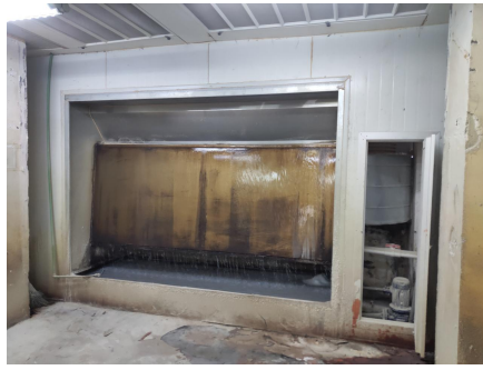
官清村车间 5F 喷漆车间喷漆柜